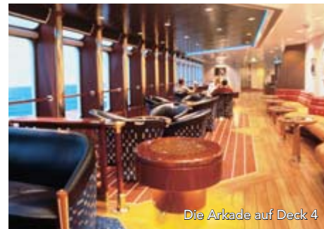
Die Arkade auf Deck 4